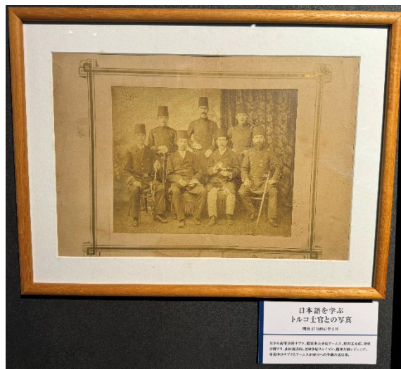
日本語を学ぶトルコ士官の写真